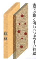
凹凸の大きな塗材